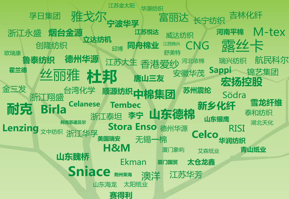
2013年粘胶论坛参会群体结构